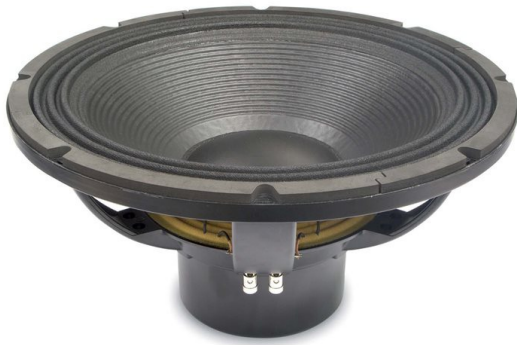
FREQUENCY RESPONSE MADE IN 180 LT. ENCLOSURE TUNED AT 35 Hz IN FREE FIELD (4m) ENVIRONMENT. ENCLOSURE CLOSES THE REAR OF THE DRIVER.